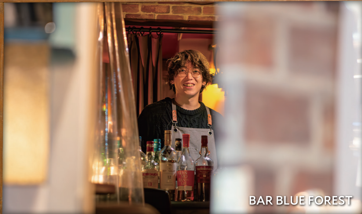
BAR BLUE FOREST