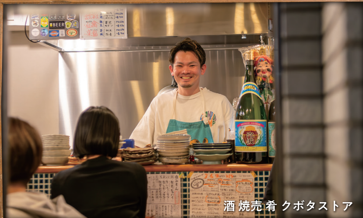
酒焼売肴クボタストア